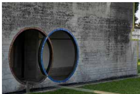
Fig 13 - Marcel Breuer, De Bijenkof Store, Rotterdam, 1955-57, detalhe da fachada.