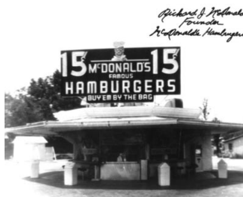
Fig 21. The first McDonalds, San Bernadino, EUA, 1948.