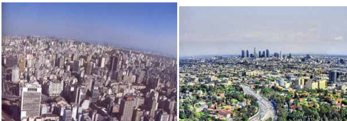
Fig 18. Los Angeles. Mulholland Drive.

A arquitetura moderna está pouco presente nos centros urbanos, mas sim escondida em subúrbios e áreas periféricas ou mesmo rurais . Não são obras fáceis de ser vistas e vivenciadas por um público mais amplo. Como Richard Longstreth advertiu, “o grande problema é que nós não conseguimos ver grandes marcos da arquitetura moderna, não conseguimos apreendê-los de um ponto de vista único ou monumental”. 37 Alguns dos melhores exemplos de residências modernas encontram-se em áreas rurais, como nos casos de muitas casas norte-americanas, ou escondidas em subúrbios de São Paulo, Cidade do México ou Los Angeles.