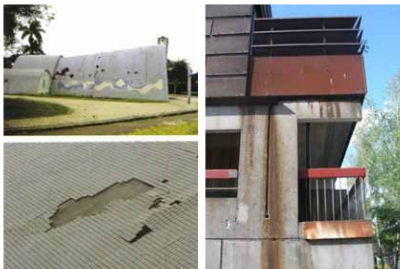
Fig 9. Oscar Niemeyer, Igreja de São Francisco, Pampulha, em 2004.

Em terceiro lugar, devem-se mencionar as falhas na construção devido à mão de obra pouco qualificada, às restrições orçamentárias e ao pouco conhecimento sobre o comportamento e o envelhecimento dos materiais. A igreja de São Francisco da Pampulha (1943), de Oscar Niemeyer, é um ótimo exemplo. O projeto original previa três juntas de dilatação na abóbada principal de concreto, mas só duas foram construídas, e ainda assim fora das especificações. O resultado é que as pastilhas começaram a se soltar após alguns anos do término da construção, um problema que reapareceu constantemente nos anos seguintes, até terem sido sanadas na última restauração, em 2004. 27