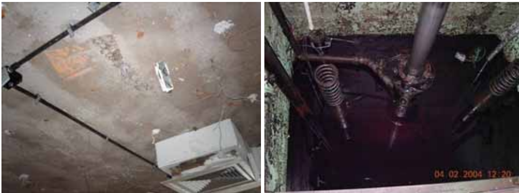
Fig 11 - Acácio Borsoi, Edifício do Bandepe, Recife, 1967-70, sistemas elétrico e de ar condicionado.

Os sistemas infra-estruturais (aquecimento, resfriamento, água, eletricidade, redes de comunicação) assistiram a um enorme avanço nestas últimas décadas e são cada vez mais importantes no edifício contemporâneo. Muitas vezes, essas infraestruturas precisam ser substituídas para que o edifício possa continuar a ser utilizado. As partes metálicas sofrem erosão e corrosão. Em linhas gerais, esses sistemas são trocados por inteiro e raramente conservados. Tal fato acarreta uma série de problemas para a conservação de um edifício que possui uma vida útil mais longa que a dos seus sistemas. O prazo de vida de um sistema desses gira em torno de 30 anos. Então, um edifício com cerca de 60 anos teria seus sistemas trocados pelo menos uma vez. Se esse edifício adquiriu significância para determinada sociedade, um problema surge, pois o edifício precisará da renovação de tais sistemas para se manter em uso (e, conseqüentemente, bem conservado), e a introdução dos sistemas pode alterar características significativas do edifício. 32 Devemos aceitar a necessidade de mudança, mas faz-se necessário um cuidadoso trabalho de adequação dessas novas estruturas. Os sistemas antigos representam um testemunho importante de nossa forma de morar no passado e não devem ser descartados, mas, sempre que possível, preservados ao lado dos novos como um registro.