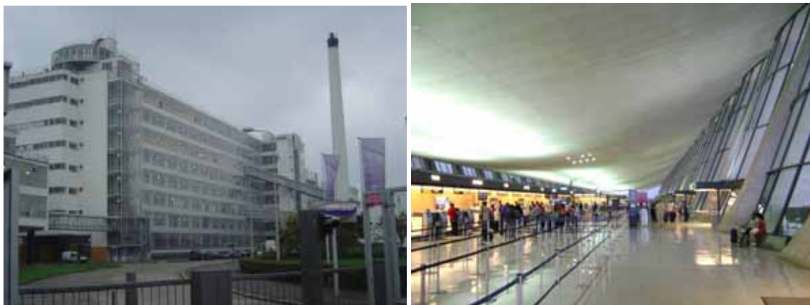
Fig 3. Brinkmann & van der Vlugt, Van Nelle Factory, Rotterdam, 1927-29 Foto: Fernando Diniz Moreira.

transformações que o mercado impõe (no segundo caso), tornaram-se obsoletas. O Aeroporto Dulles e o terminal da TWA no Aeroporto JFK em Nova York, ambos de Eero Saarinen são ótimos exemplos de formas que ficaram obsoletas imediatamente após a inauguração, devido ao enorme aumento do número de voos e às novas medidas de segurança. No entanto, como marcos da arquitetura do século XX, foram preservadas, embora com um custo operacional alto. 14