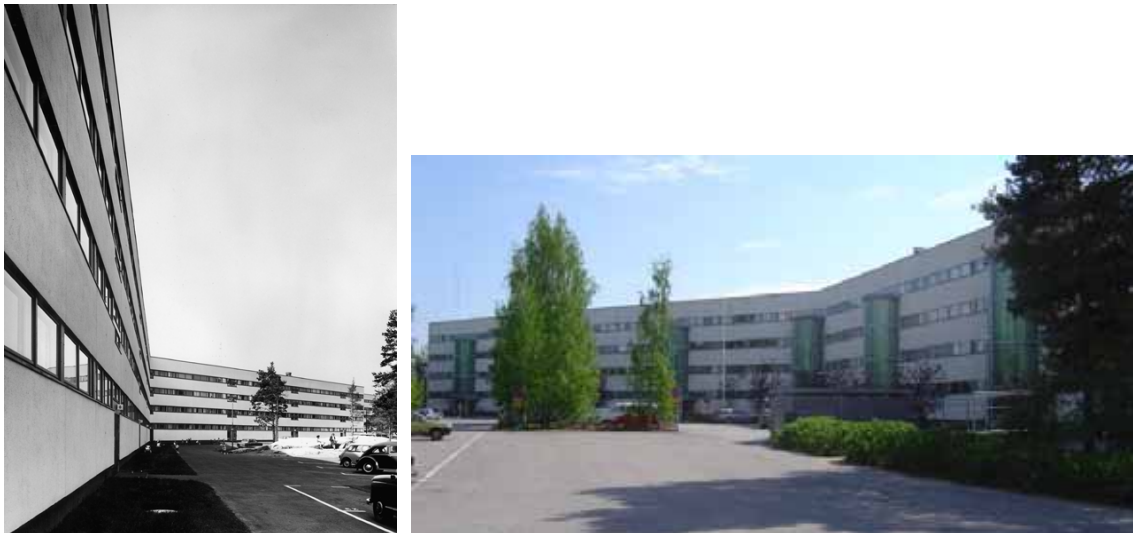
Fig 16. Pihlajamaki, blocos originais.