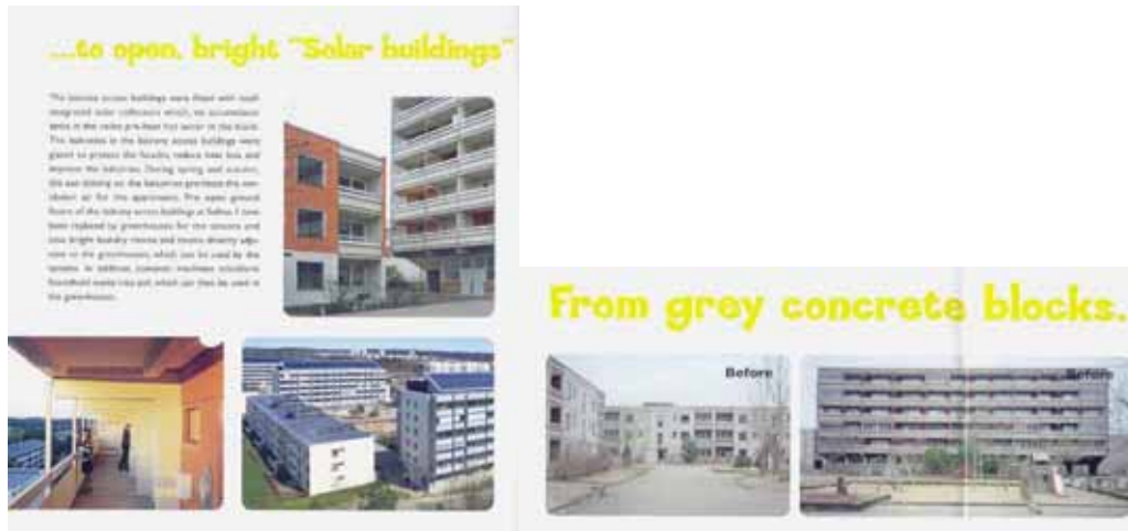
Fig 15. Gårdsten. Antes e depois da intervenção.