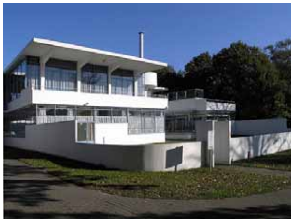
Fig 5. Duiker & Bijvoet, Zonnestraal Sanatorium, Hilversum, 1927.

para os quais foram construídos, sendo o primeiro reconstruído em 1986. O sanatório Zonnestraal em Hilversum, Holanda, foi projetado por Duiker e Bijvoet para durar apenas 30 anos, segundo com o qual se acreditava que a tuberculose estaria extinta na Europa. O concreto foi feito de uma forma tão fluida que, cinquenta anos após a construção, sua estrutura estava totalmente comprometida, o que acarretou desafios para a conservação. 19