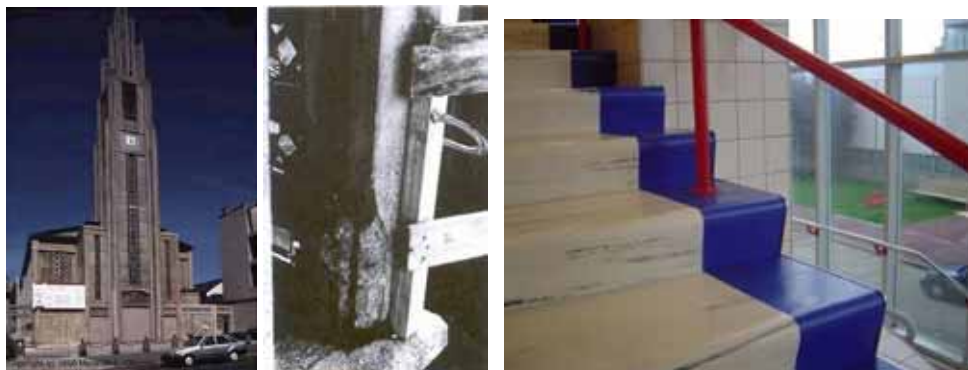
Fig 6 - Auguste Perret, Notre Dame du Raincy, 1923.